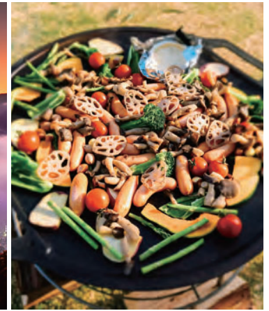
脱炭素の実証地 ウマバ・スクールコテージ