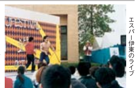
エスパー伊東のライブ

第十七回杏樹祭は、「創造」をテーマに開催。このテーマはこれまでの習慣や他大学の情報によらず、香川校から新しい文化や情報を発信していくという願いがある。今の我が国に求められるのは、発想の転換であり、独創的な発想であるが、杏樹祭を契機に若々しい発想をもって期待に応えようとした。 屋内では文化部や同好会による日頃の研究や作品発表。屋外特設ステージでは、歌やダンス、軽音楽等が観衆を沸かせた。また、地域連携による源内太鼓やエアロビクスが地域の有志により熱演された。メインストリートには呼び込みの声も高く模擬店が並び、客足の絶える間もなく繁盛した。 さらにメインイベントとして、テレビの人気タレントのエスパー伊東のお笑いライブにスタージェシカが観衆が一体となり大ブレイク。テレビアニメ声優のアイドル野川さくらトークとライブ。はるばる埼玉県や静岡県から彼女を追ってきたファンもいた。 地域の皆様、各サークル等の多くの協力によりすば