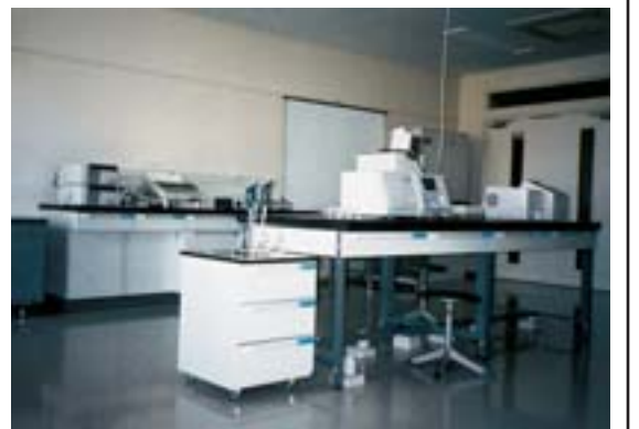
徳島校チャレンジラボ研究施設

さらに、院生・学生からの求めに応じて、教員が側面からアドバイスを行うことができる支援体制を整えている。