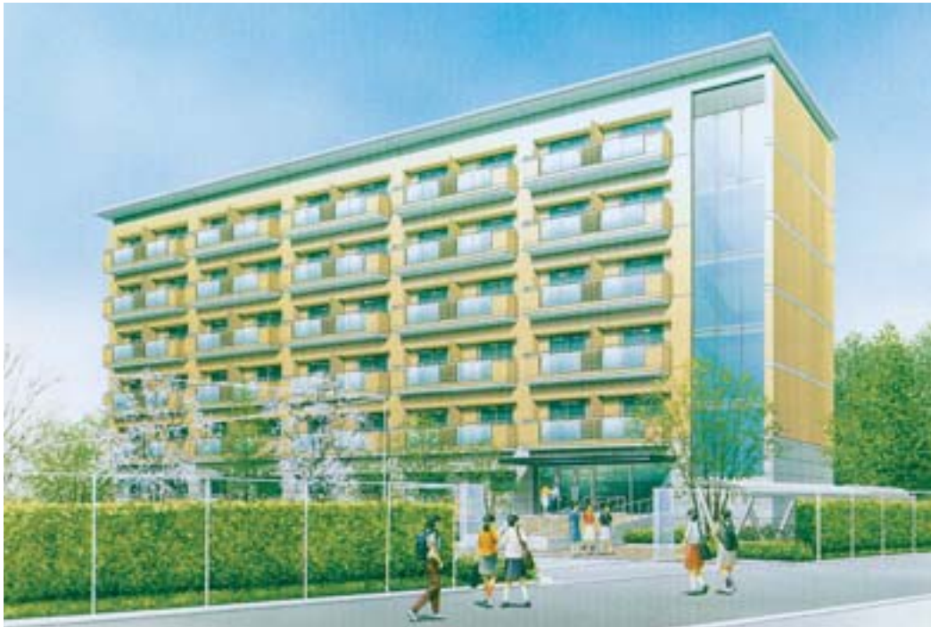
豪華な設備の整った新学生寮完成予想図

Acanthus 属の一種、アカンサス・モリスの葉を河野太郎元教授により図案化されたのが、本学の校章である。 アカンサスは地中海沿岸の原産で、アザミに似た多年草または小灌木で、その名称はギリシア語の「刺」に由来しており、その葉は古代からギリシ