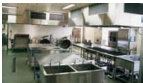
機器も最新の実習室

給食管理実習室は、短期大学部生活科学科食物専攻と人間生活学部食物栄養学科の学生が給食運営管理実習に使用する。十四年秋に十四号館一階に改築・移転した。栄養士法の改正により、衛生管理上、厨房のドライシステム化が必要となったためである。