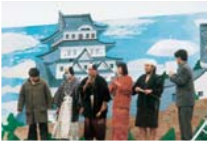
定期公演のあいさつ

香川校演劇部は、現在十二名で活動をしています。主な活動は毎年六月と十月に行う定期公演で、大学の部活動は毎週月・水・金曜日に体育館のステージで練習をしています。 昨年度の六月の定期公演「浮かれすぎた日、新世紀」は、当日の雨で雨で雨で、十月の定期公演「スペース・トラベラーズ(完全版)」では本学の大学祭期間中ということもあり、本学の学生だけでなく一般の方など多くの方に見て頂くことができました。今年の