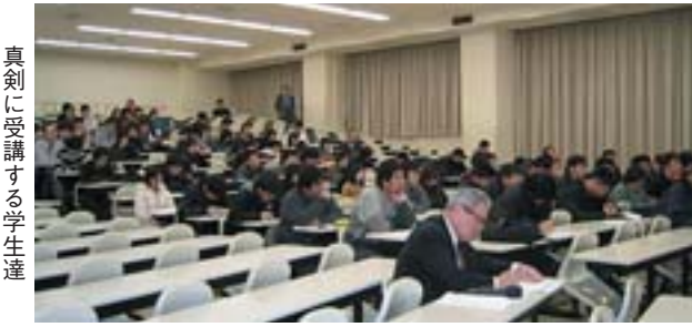
真剣に受講する学生達

ステップアップ講座は、各種の就職試験対策並びに就職意識の高揚を図るため開講しました。一般就職のほか公務員、専門職等の試験対策として役立つもので