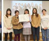
▲女子学生による私の未来を語る大会、最優秀賞受賞