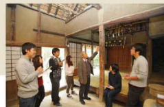
▲文化庁「ユネスコ世界科学史遺産