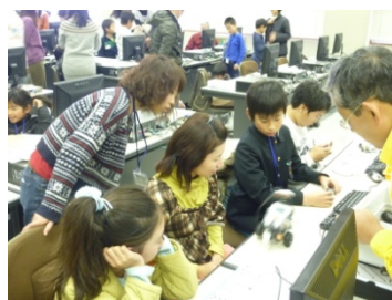
プログラムの入力