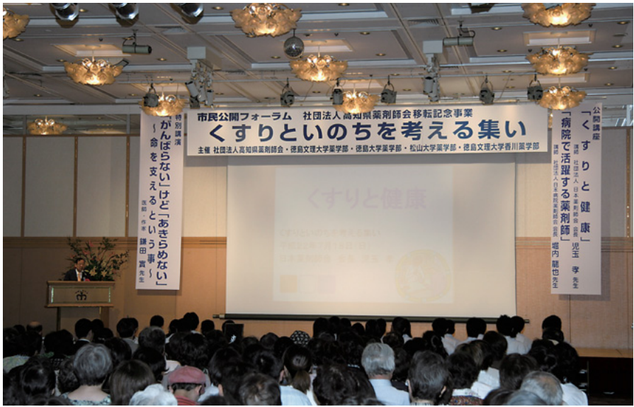
7月18日(日)高知新阪急ホテル(高知市)にて

4年前に始まった薬学部の新しい教育制度の理念とその現状、および薬剤師の近未来像についての講演会と討論会が「日本の薬学、四国の薬学部」と題して、高校生や保護者を対象に行われた。この催しは、本学の薬学部と香川薬学部、松山大学、徳島大学の3大学4薬学部が主催し、5月15日(土)には香川県立ミュージアムで、6月12日(土)は徳島大学で、7月10日(土)は松山大学で、7月18日(日)は高知新阪急ホテルで開催した。