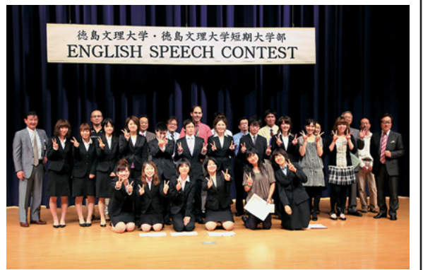
徳島文理大学・徳島文理大学短期大学部 ENGLISH SPEECH CONTEST