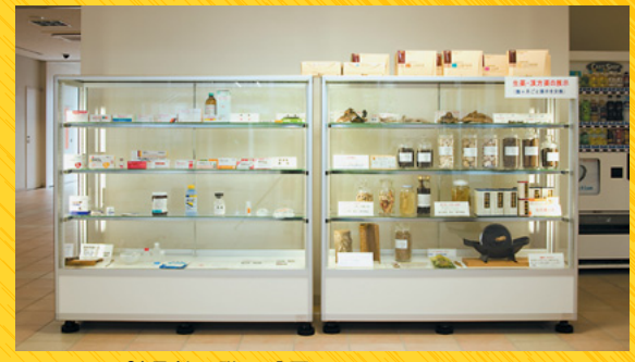
21号館1階に設置されたショーケース

行っている。9月に車検をして、公道走行も行いながら種々のデータ採取を行っている。よりよいものに仕上げたい、よりよいものに仕上げたいと予定である。