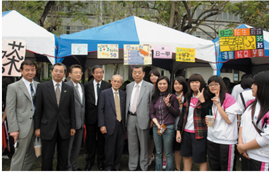
園遊会(文化祭)での様子=新民高級中学

23日(金)には、本学の高大連携校である台中市の新民高級中学の創立記念式典に参列し、招待された多数の来賓の代表と