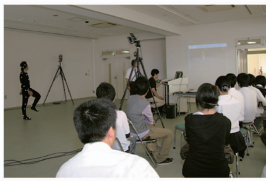
理学療法学科によるモーションキャプチャー(徳島キャンパス)

本学のオープンキャンパスは、開催時期や来場者のニーズにあわせて、1年間を3つのステップ(考える・分かる・実現する)に分けて実施している。 3月の「考えるオープンキャンパス」に続き、徳島キャンパス6月19日(土)、香川キャンパス6月20日(日)・7月18日(日)に分かるオープンキャンパスを開催した(7月18日(日)は「さいえんす茶房 in 讃岐」も同時開催)。 「学びが分かる」「入試が分かる」「キャンパスライフが分かる」「大学が分かる」をキーワードに、さまざまなイベントを実施している。 高校生からは「大学生活を楽しく体験できてよかった」「在学生と接することができてよかった」などの感想が寄せられた。 笑顔あふれる杏樹祭を皆で作りに上げていきますので、ぜひ遊びに来てくださいます。皆さんの来場を心よりお待ちしております。