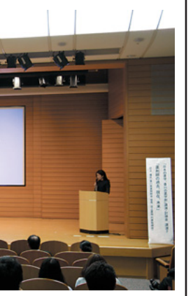
5月15日(土)香川県立ミュージアム(高松市)にて

4年前に始まった薬学部の新しい教育制度の理念とその現状、および薬剤師の近未来像についての講演会と討論会が「日本の薬学、四国の薬学部」と題して、高校生や保護者を対象に行われた。この催しは、本学の薬学部と香川薬学部、松山大学、徳島大学の3大学4薬学部が主催し、5月15日(土)には香川県立ミュージアムで、6月12日(土)は徳島大学で、7月10日(土)は松山大学で、7月18日(日)は高知新阪急ホテルで開催した。