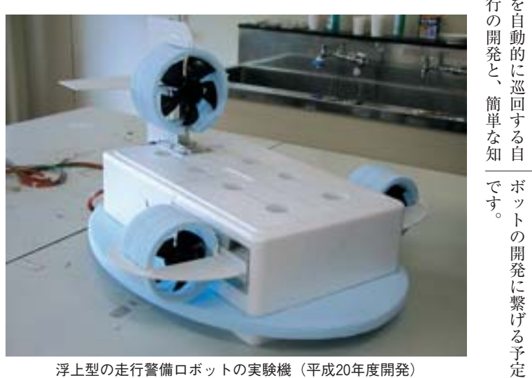
浮上型の走行警備ロボットの概略図(初期計画)

私たちの研究室は、平成19年4月にはじめて卒業研究を迎え、創造的なものづくりに主眼をおいた、新しい研究を充足させました。それは無人工場や原子力発電所など、高い安全性の維持・管理が求められる施設の中で、警備のため、床面を浮上走行し、施設内を自動的に巡回する浮上型走行警備ロボットの開発です。このロボット開発の背景には、近年ものづくりの生産現場において、自動化が進みます進展し、大規模な無人工場が数多く建設されていること、そして高い品質の安定した生産を守るため、工場内の異常事態を早期に発見し適切に対処する、警備を目的とした自律走行