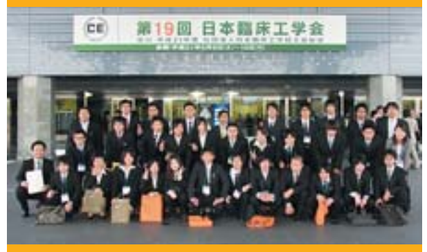
第19回日本臨床工学会 (アスティ徳島エントランス前) 記念撮影

平成21年5月9日(土)と10日(日)の2日間アスティ徳島で「第19回日本臨床工学会」が開催された。臨床で働く臨床工学技士の方々と、医療関係企業の方々など全国から約1800人が徳島に集結。臨床工学会では、今回の学会を一大イベントと位置付け、バスをチャーター